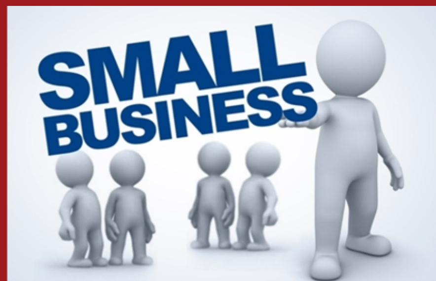
Малий та середній бізнес