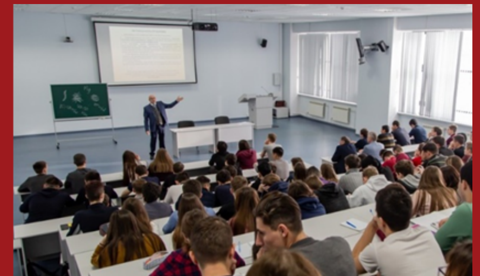
Освіта та інші сфери