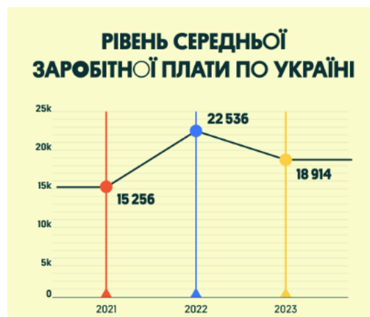
Рисунок 3.2 - Динаміка зміни середньої заробітної плати в Україні, тис.грн.

Також у даному підрозділі може бути приділена увага дослідженню галузі, в якій працює підприємство (за даними http://www.ukrstat.gov.ua/ . або регіональних служб статистики). Наприклад: