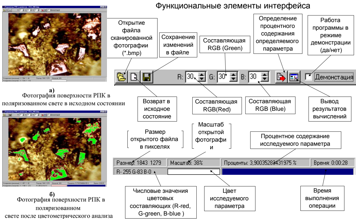
Рисунок 1- Компьютерная цветометрическая методика изучения параметров рабочей поверхности алмазного круга