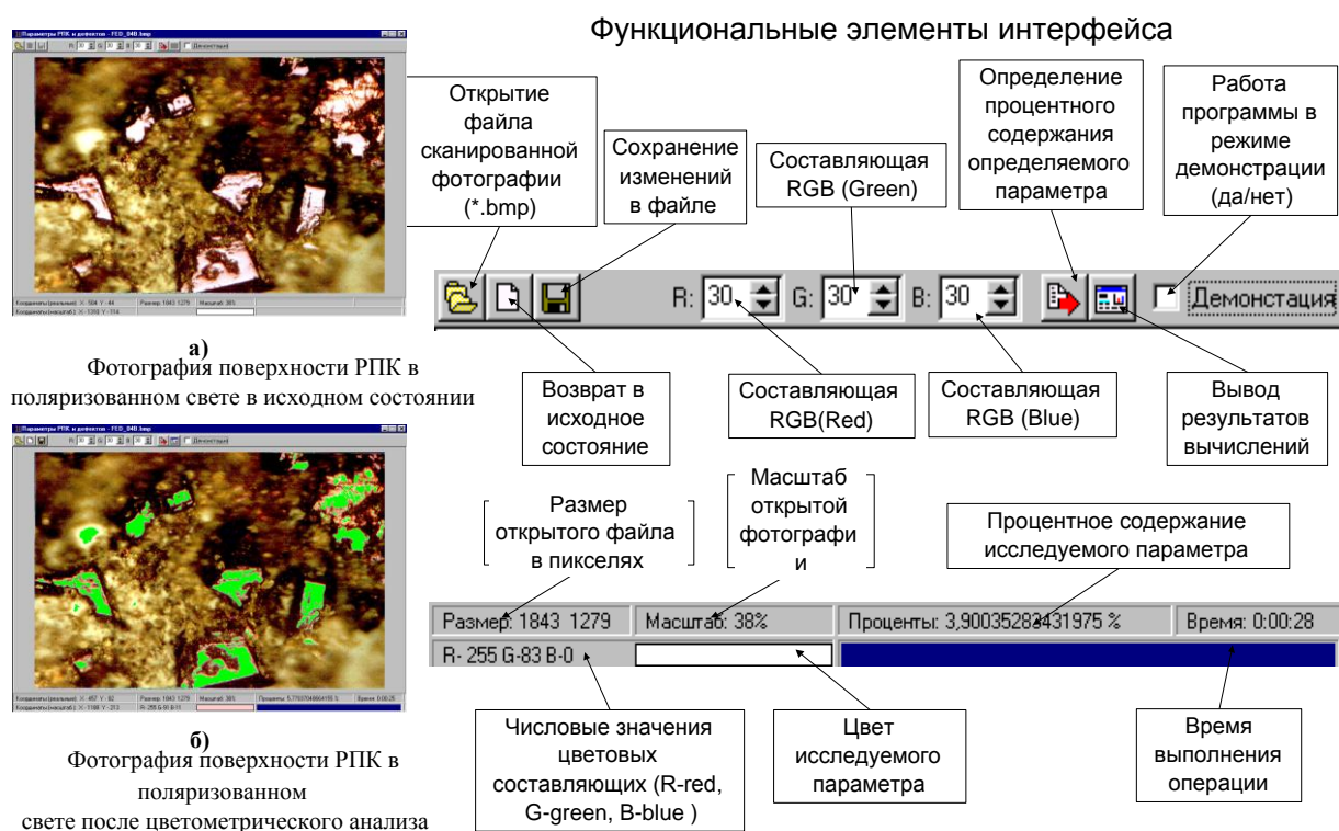
Рисунок 1- Компьютерная цветометрическая методика изучения параметров рабочей поверхности алмазного круга

Вибір мови програмування Delphi пов'язаний зі зручністю обробки дуже об'ємних структур даних, а також з можливістю реалізації зручного інтерфейсу (мал. 1).