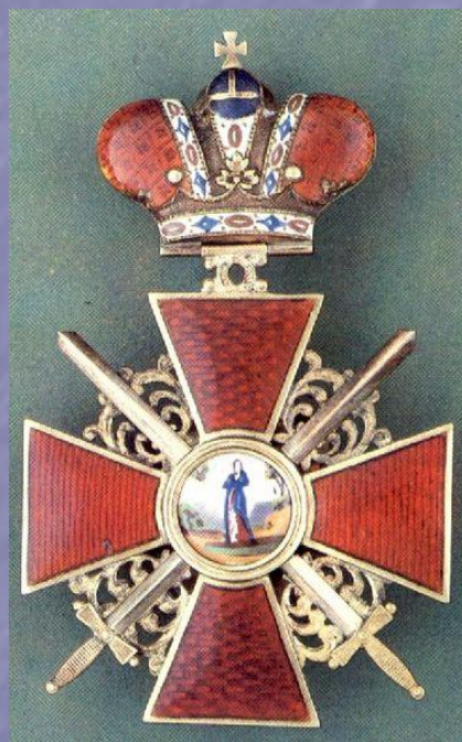
Орден св. Анны 2-й степени