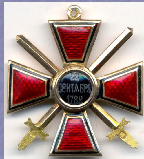
Орден Владимира 4-й степени