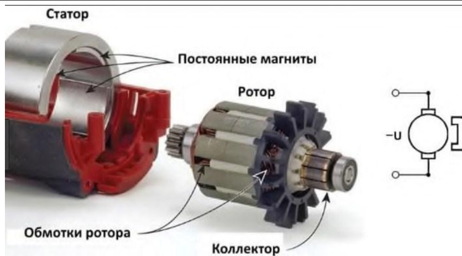
Коллекторна машина зі збудженням від постійних магнітів

Електрична машина на постійних магнітах не сильно відрізняється по виду конструкції. При цьому, можна виділити наступні основні елементи: Зовні використовується електротехнічна сталь, з якої виготовляється осердя статора. Потім йде стрижнева обмотка, хрестовина ротора і за нею спеціальна пластина. Потім, виготовлені з електротехнічної сталі, секції осердя ротора. Постійні магніти є частиною ротора.