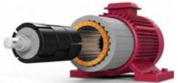
Синхронна машина з постійними магнітами на роторі