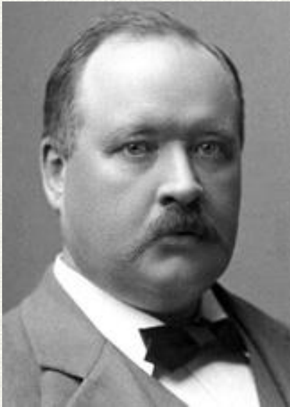
Сванте Арреніус (1859–1927)

Першу кількісну теорію розчинів електролітів висунув С.Арреніус у 1883-87р., а подальший розвиток ця теорія дістала в роботах В.Оствальда, П.Вальдена, Л.В.Писаржевського та ін.