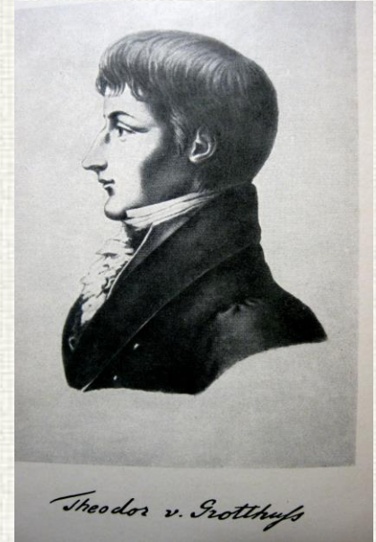
Теодор Гротгус (1785 - 1822)