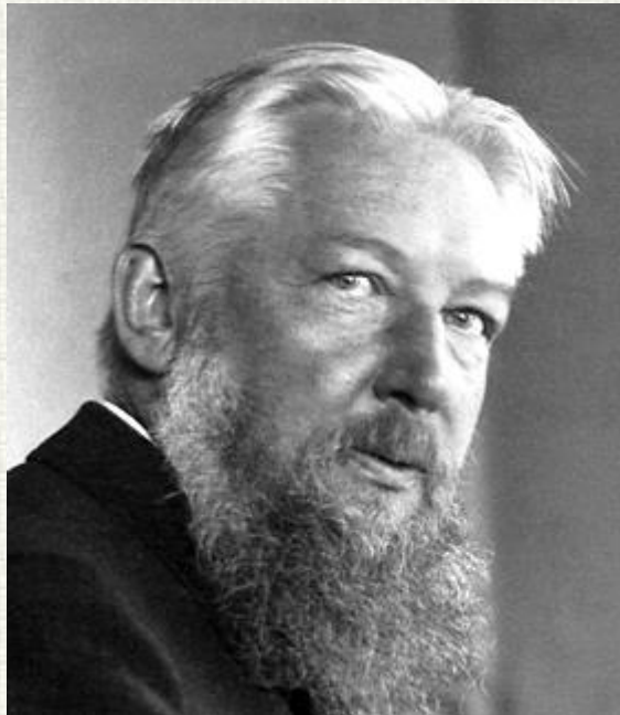
Вільгельм Оствальд (1853 – 1932)