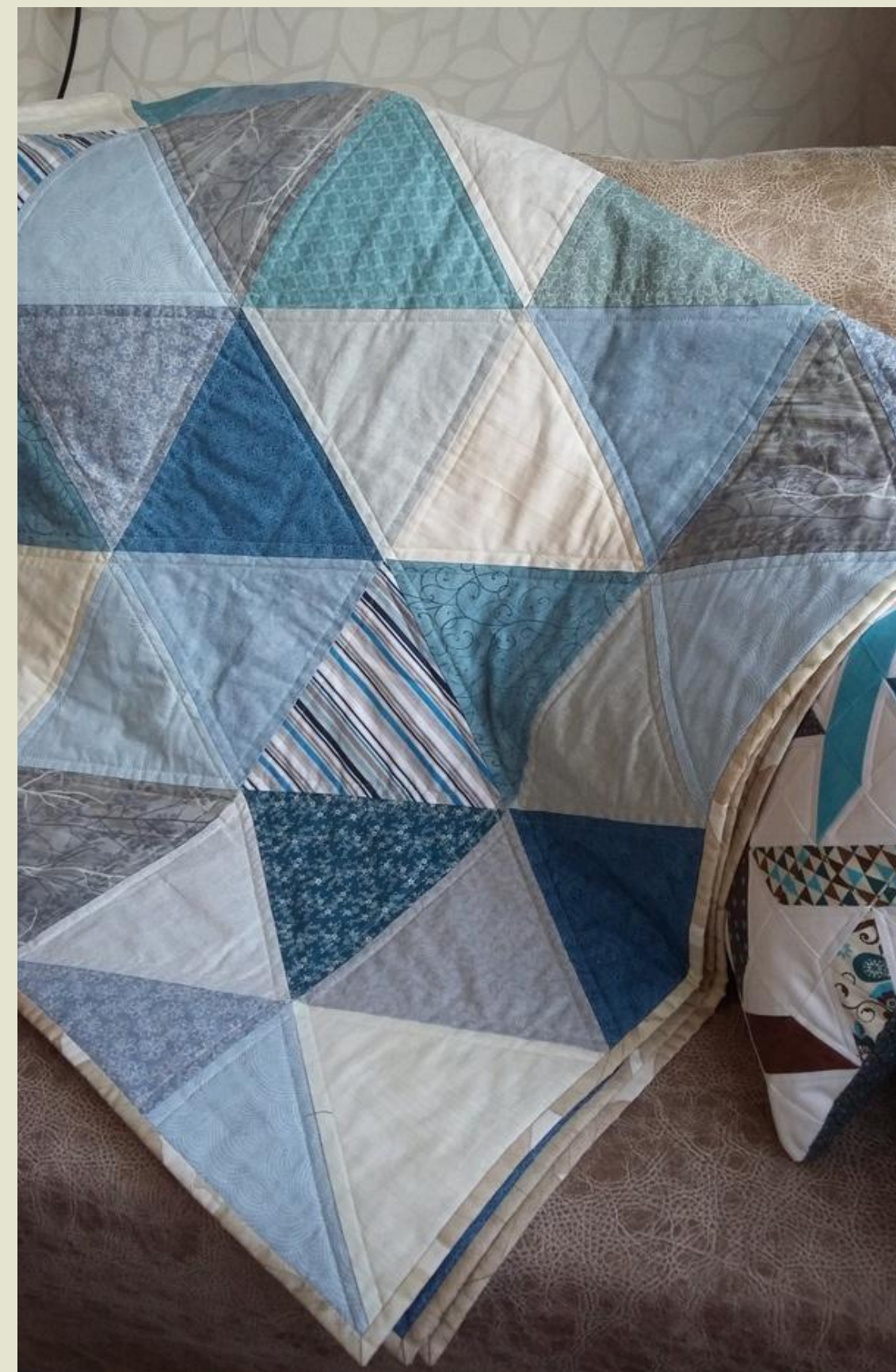
Плед у стилі печворк з бавовняних речей (без наповнювача)