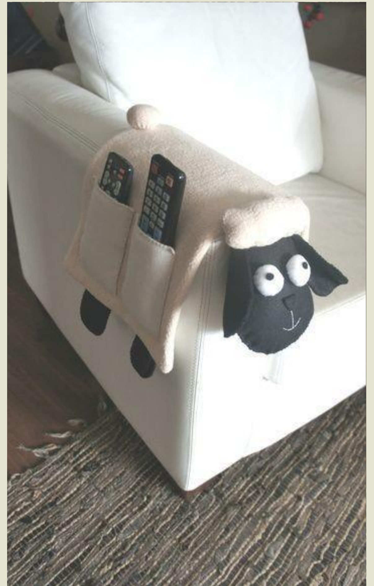
Органайзер з м'якого ведмедя