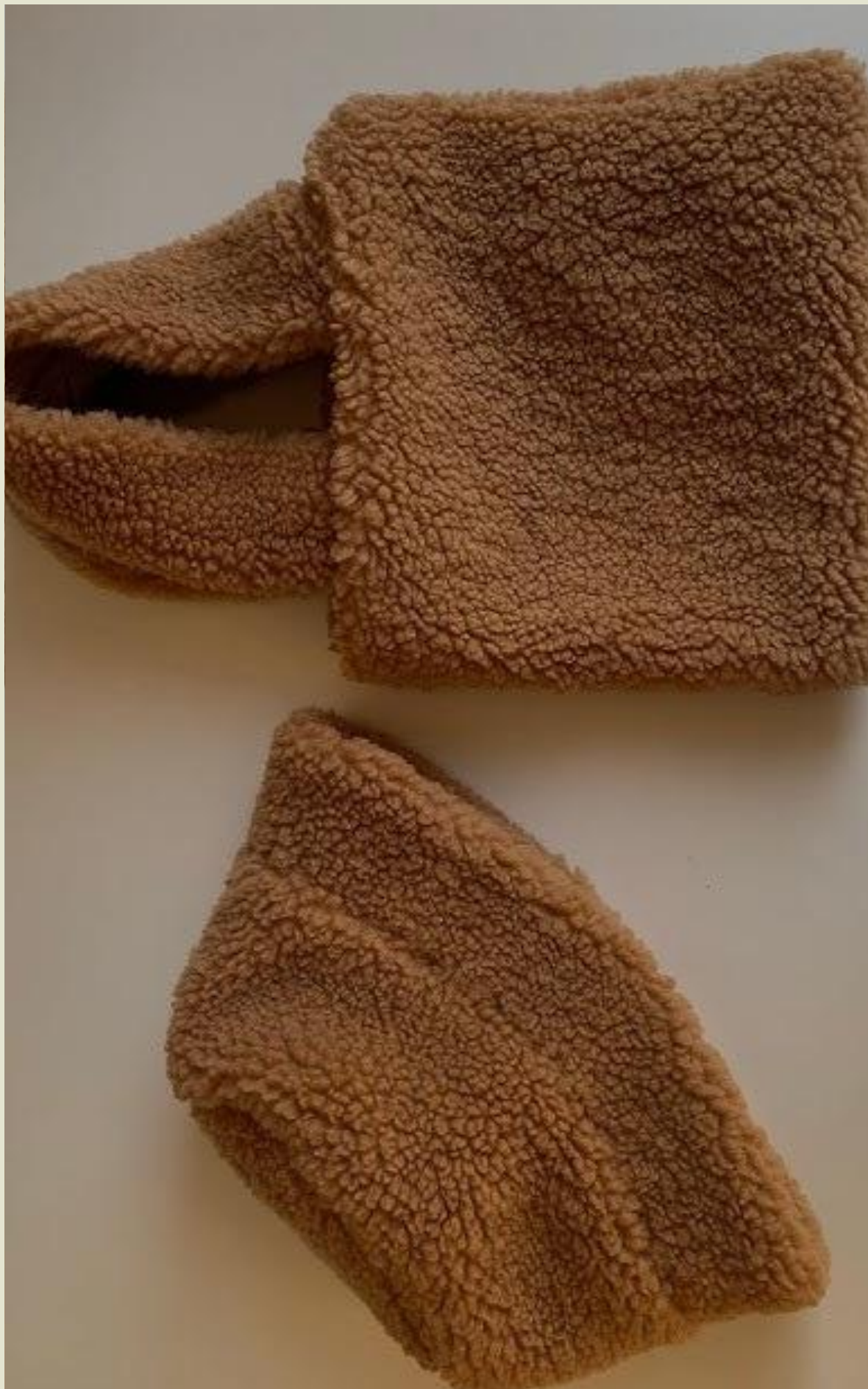
Панамка та шопер з тедді шуби