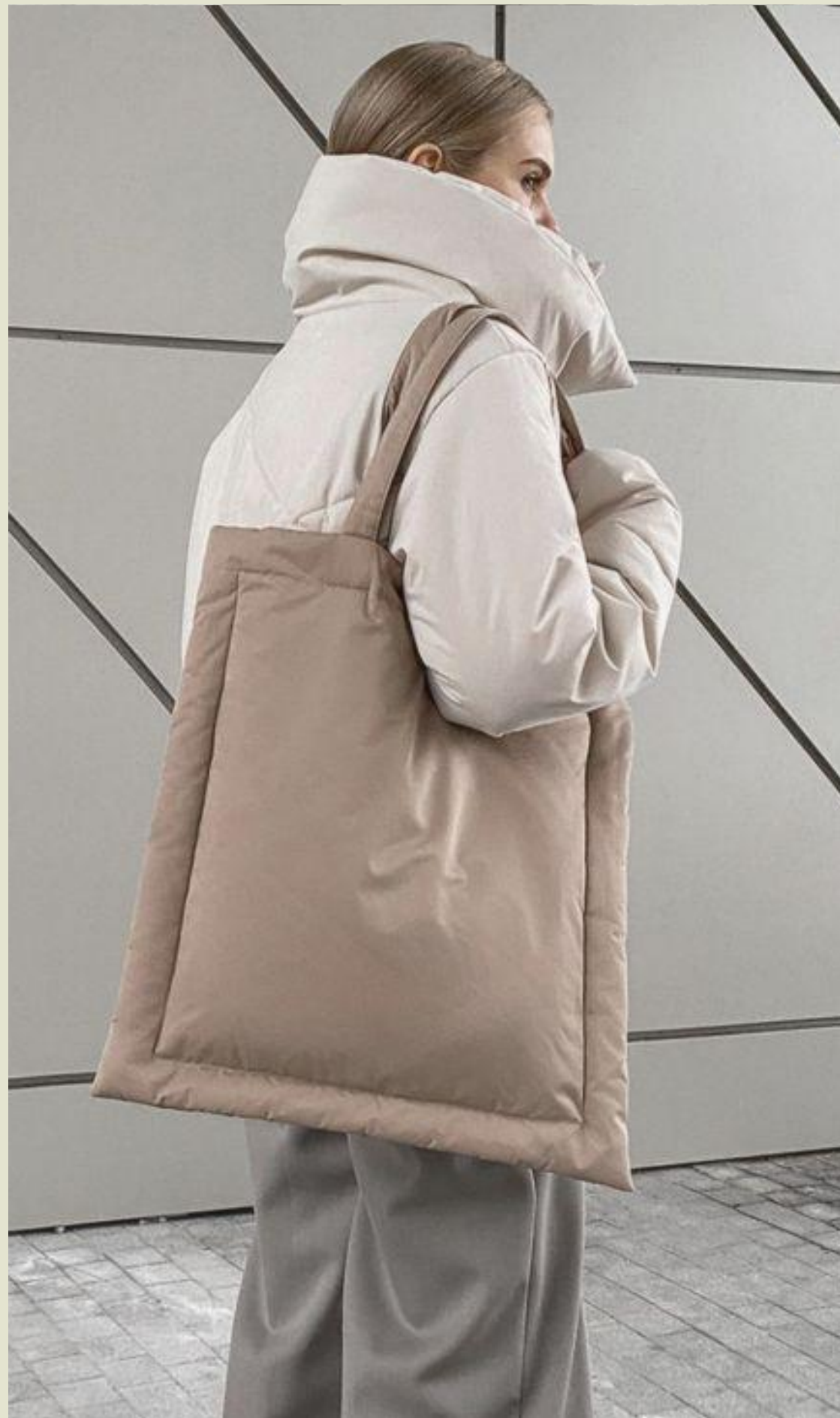
Шопер з зимової куртки