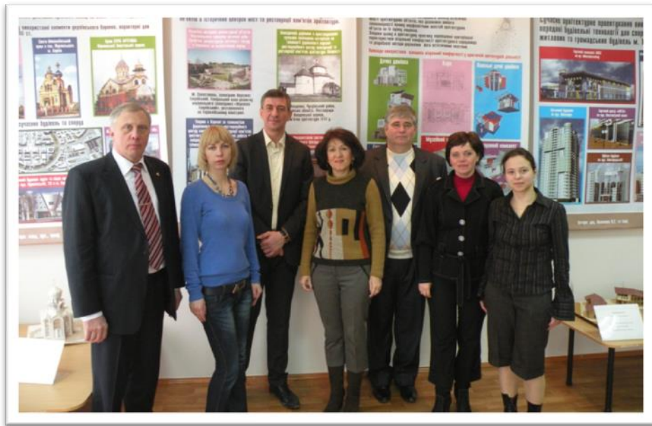
Співробітники факультету – учасники науково-практичної конференції «Європейські та традиційні українські цінності очима сучасної української молоді» (2012 р.)

З 2009 року на ФІП починають працювати курси іноземних мов (англійська, німецька, французька), де студенти університету мали можливість підвищити свій мовний рівень, а також отримати необхідні знання для здачі вступного іспиту до магістратури.