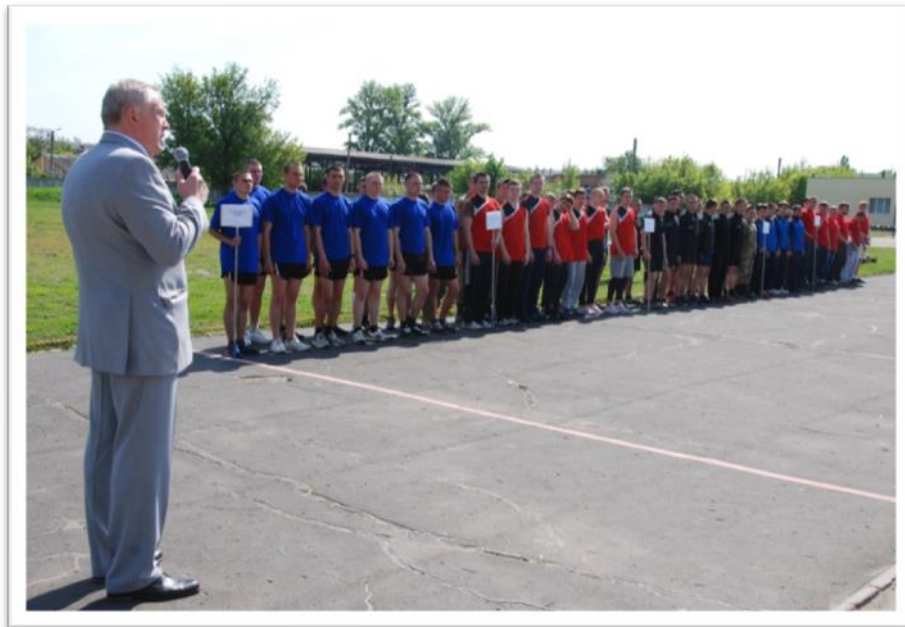
На відкритті військово-спортивних ігор «Заграва» (2016 р.)

У 2014 році рішенням установчих зборів, в яких приймали участь співробітники факультету інтегральної підготовки, було створено наукову громадську організацію «Академія військово-історичних наук і козацтва». Академія об'єднує на добровільних засадах ентузіастів, фахівців і учених з військової історії та історії козацтва, геральдики та фалеристики, військової техніки та споріднених галузей [2]. Метою Академії є консолідація інтелектуального потенціалу суспільства в інтересах підвищення ефективності науково-дослідної діяльності, що спрямована на вивчення питань побудови майбутнього суспільства без війн та збройних конфліктів, а також виконання благородної місії по збереженню в історії й пам'яті людства подій та імен героїв різних історичних епох.