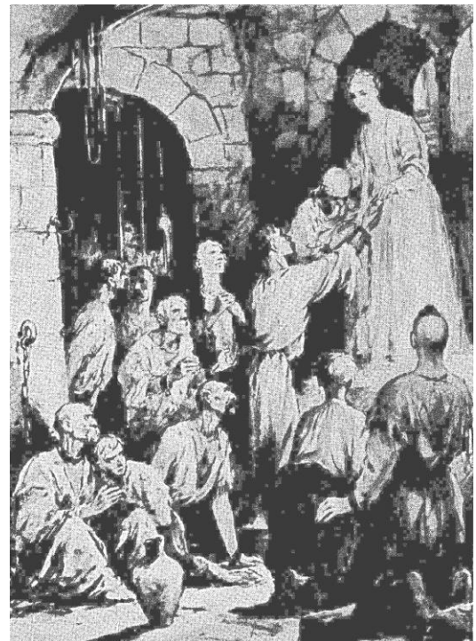
Дума про Марусю Богуславку. 1947