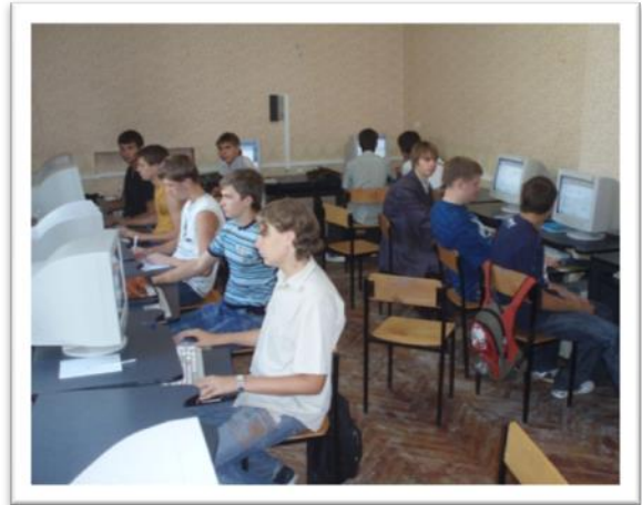
Навчальний процес у аудиторіях факультету