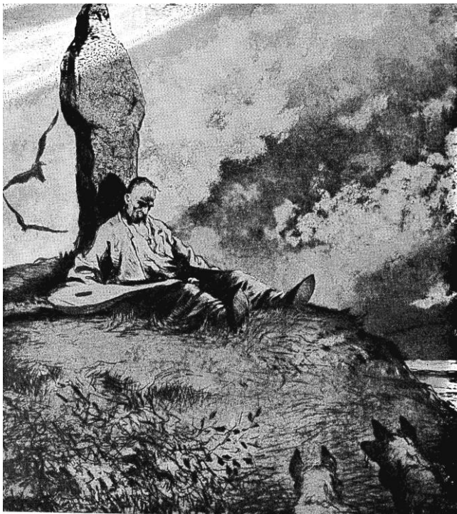
Дума про козака-бандуриста. 1945