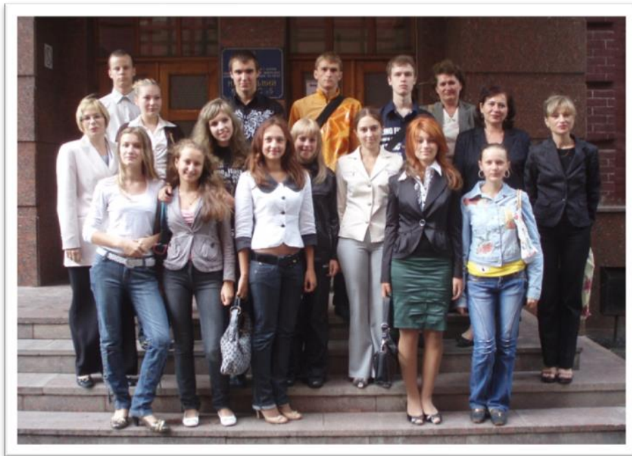
Першокурсники із співробітниками деканату (2008 р.)

татами було запрошено студентів, що закінчили 1 курс денного навчання, на 2 курс заочного навчання факультету ІІІ для одержання освіти за напрямками «Менеджмент» або «Облік і аудит». На основі взаємозаліку дисциплін гуманітарного й частково фундаментального блоку був запропонований та затверджений Вченою Радою Університету навчальний план підготовки бакалавра за заочною формою навчання за 3 роки (за умови, що студент навчається на денній формі за іншим напрямом). Викладачі факультету відмічали досить високу якість навчання цих студентів, адже більшість з них були відмінниками за основною спеціальністю. Застосування модульної системи надало можливість цим студентам достроково скласти сесію за основною освітою і успішно підготуватись до сесії за заочною формою.