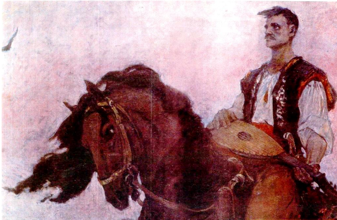
Народження пісні (фрагмент). 1957