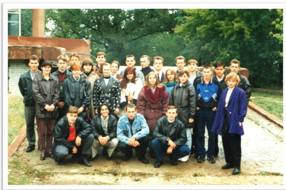
Перші студенти економіко-правового факультету (1996 р.)

Влітку 1996 року відбувся перший набір трьох академічних груп студентів денної форми навчання та двох груп заочної форми навчання, які були одночасно зараховані до двох вищих навчальних закладів – ХДПУ та УніВС.