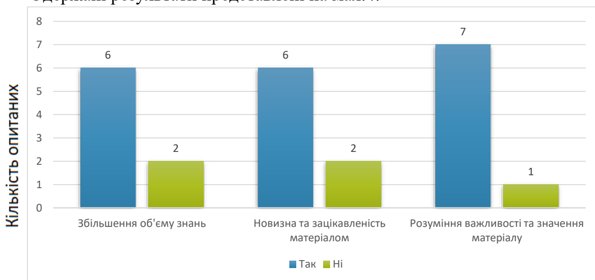
Мал. 4. Стимулювання аспірантів до науково-дослідницької діяльності

Одержані результати представлені на мал.4.