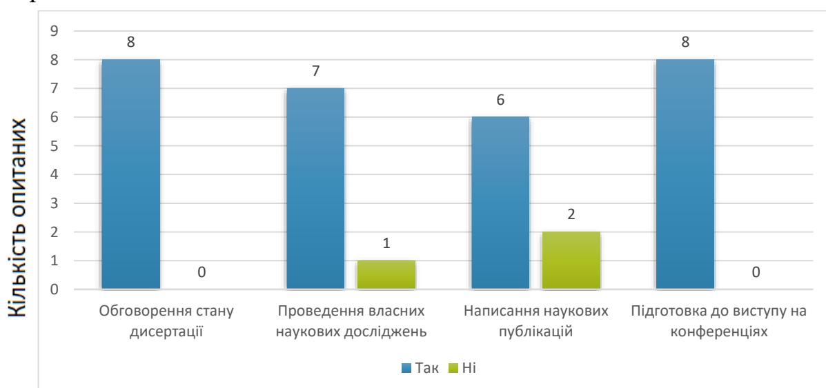
Мал.2. Оцінка участі наукового керівника в науково-дослідній діяльності аспіранта

Результати опитування аспірантів на четверте питання : «Чи надає науковий керівник необхідну допомогу в наступних діях або заходах?» відображено на мал.2.