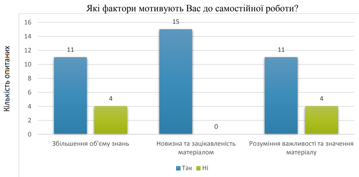
Малюнок 2. Стимулювання аспірантів до науково-дослідницької діяльності

Кількість вибору відповідей не обмежувалась. Одержані результати представлені на малюнку 2.