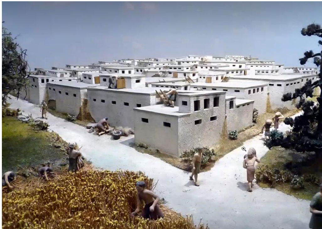
Малюнок 2. Розвиток технологій.

Новий уклад життя людини – це виробництво. Це породжувало собою велику кількість технологій: обробки землі, урожаю, технології селекції, будівництва та інші.