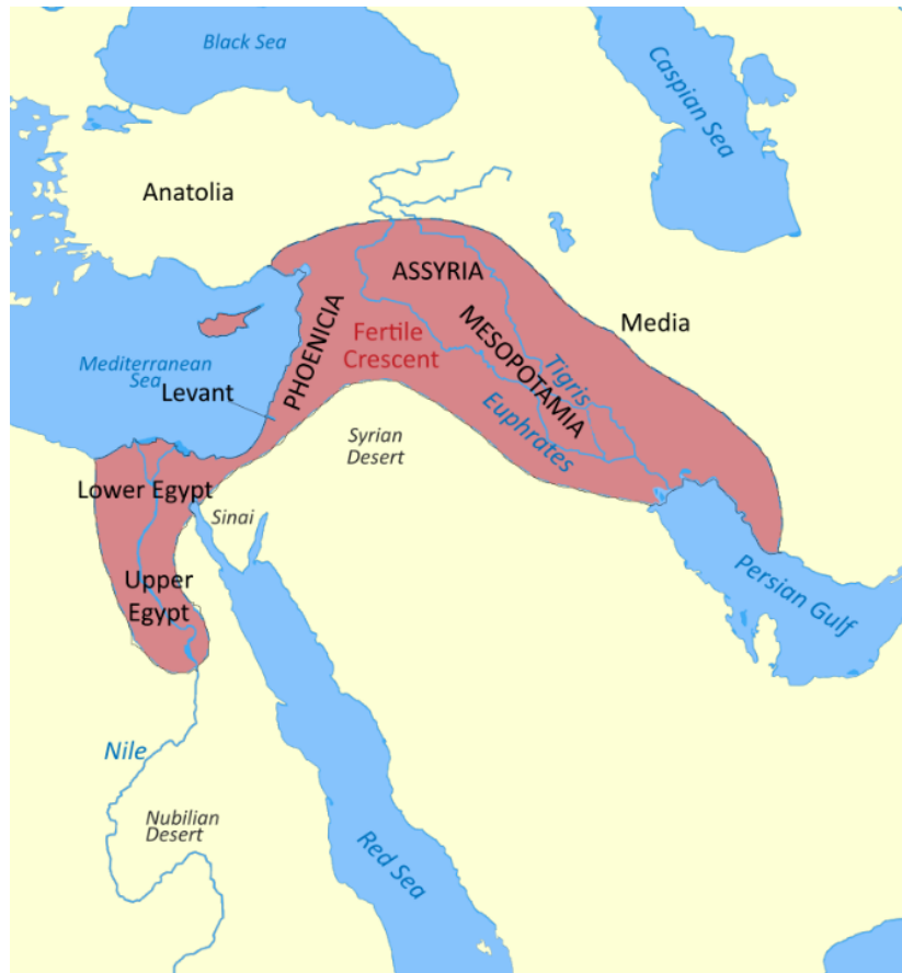
Малюнок 1. Родючий півмісяць.

Ця територія лежить у зоні середземноморського клімату, тобто, поблизу морського узбережжя, що характеризується сухим літом та дощовою зимою. Теплі середземноморські течії не допускали надто холодної зими, забезпечували сталу вологість та достатню кількість опадів. У навколишніх горах часто бувають снігопади через високу вологість. У літній період сильні вітри з внутрішніх пустельних районів може інколи підвищити літні температури, що приводить до значного зростання небезпеки лісових пожеж.