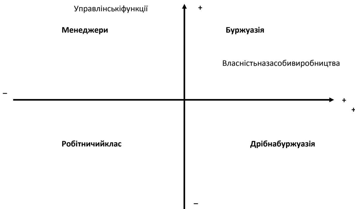
Рис.1 Класова концепція Е. Райта

2.Градаційний підхід враховує не один, а декілька критеріїв класоутворення (рід діяльності, джерело і розмір доходів, рівень освіти, стиль життя, тип помешкання, район проживання та ін.). У межах цього підходу частіше виділяються три класи (вищий, середній і нижчий), кожен з яких складається з декількох прошарків. Виник цей підхід у США і досі є популярним, тому наведемо дані з розподілу населення за класами у сучасному американському суспільстві.