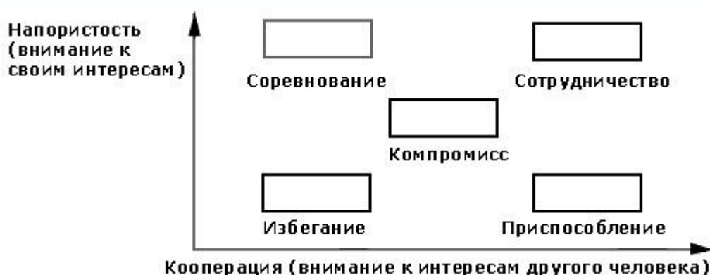
Рис.3.1. Стилі поведінки в конфлікті

К. У. Томасом і Р. Х. Кілменом проаналізовані різні стратегії поведінки у конфліктній ситуації. Існують п'ять стилів поведінки у конфлікті: притосування, компроміс, співробітництво, ігнорування, суперництво (або конкуренція ). Стиль поведінки у конкретному конфлікті визначається тим заходом, в якому ви прагнете задовольнити власні інтереси, діючи при цьому пасивно або активно, і інтереси іншої сторони, діючи спільно або індивідуально.