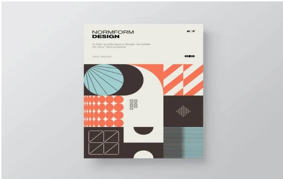
Рисунок 1.2 Приклад постмодерністської векторної графічної обкладинки