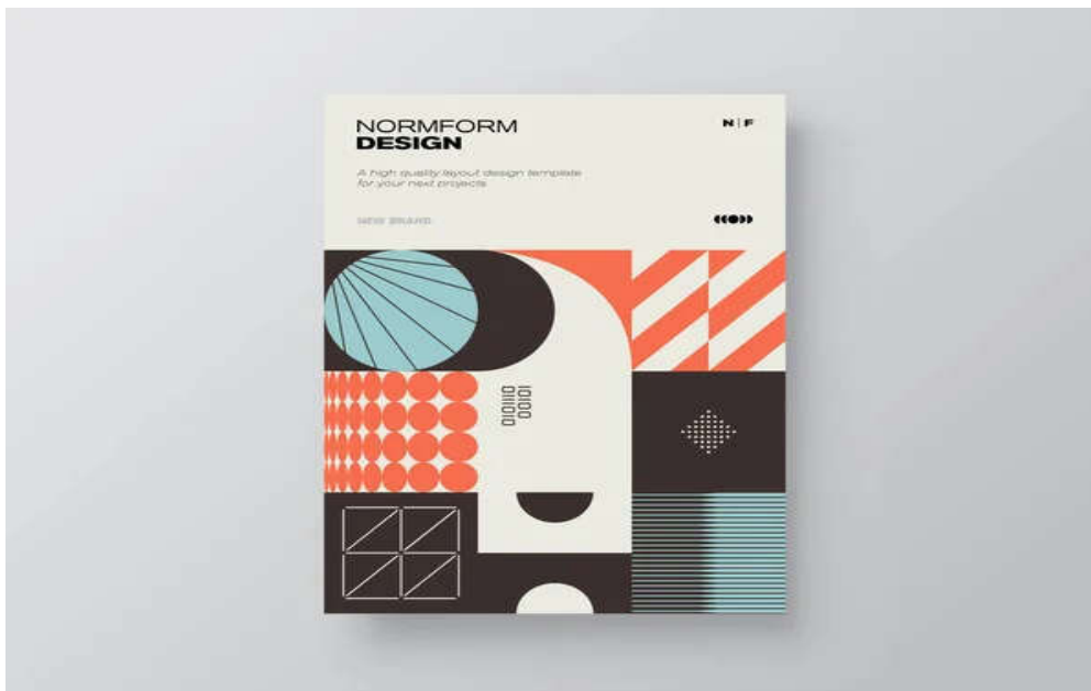
Рисунок 1.2 Приклад постмодерністської векторної графічної обкладинки