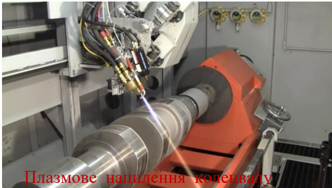
Плазмове напилення коленвалу